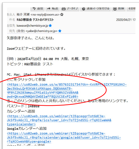
ウェビナーパネリスト招待メール (図1)